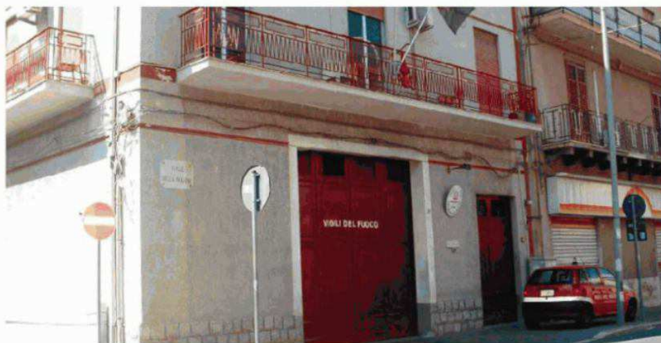
L'attuale sede del distaccamento dei vigili del fuoco di Partinico, ritenuta ormai da tempo inadeguata